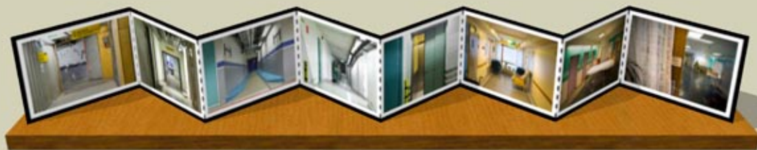
Hilsen fra Regionsykehuset-Høyblokken og kulverten