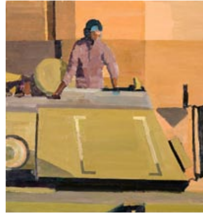
Bilvrak og Tanks