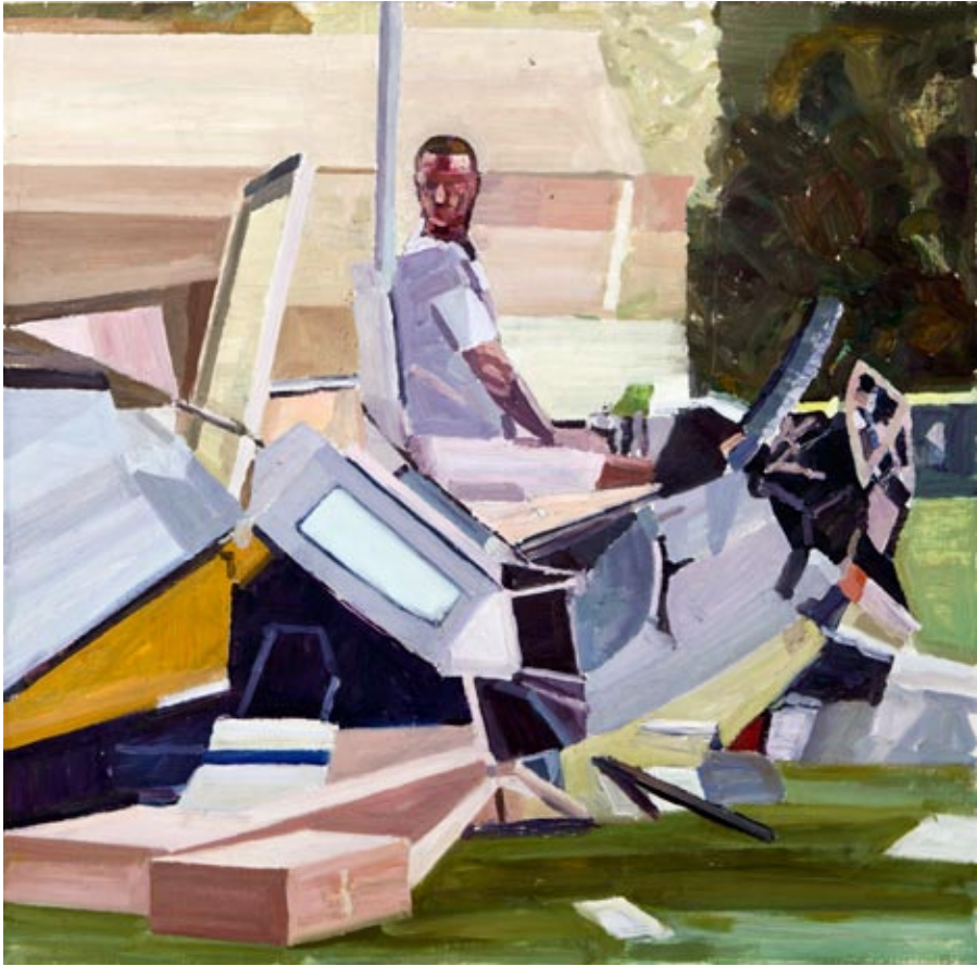
Mann og flyvrak