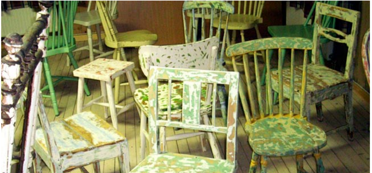
under arbeid- "Blondeemner"