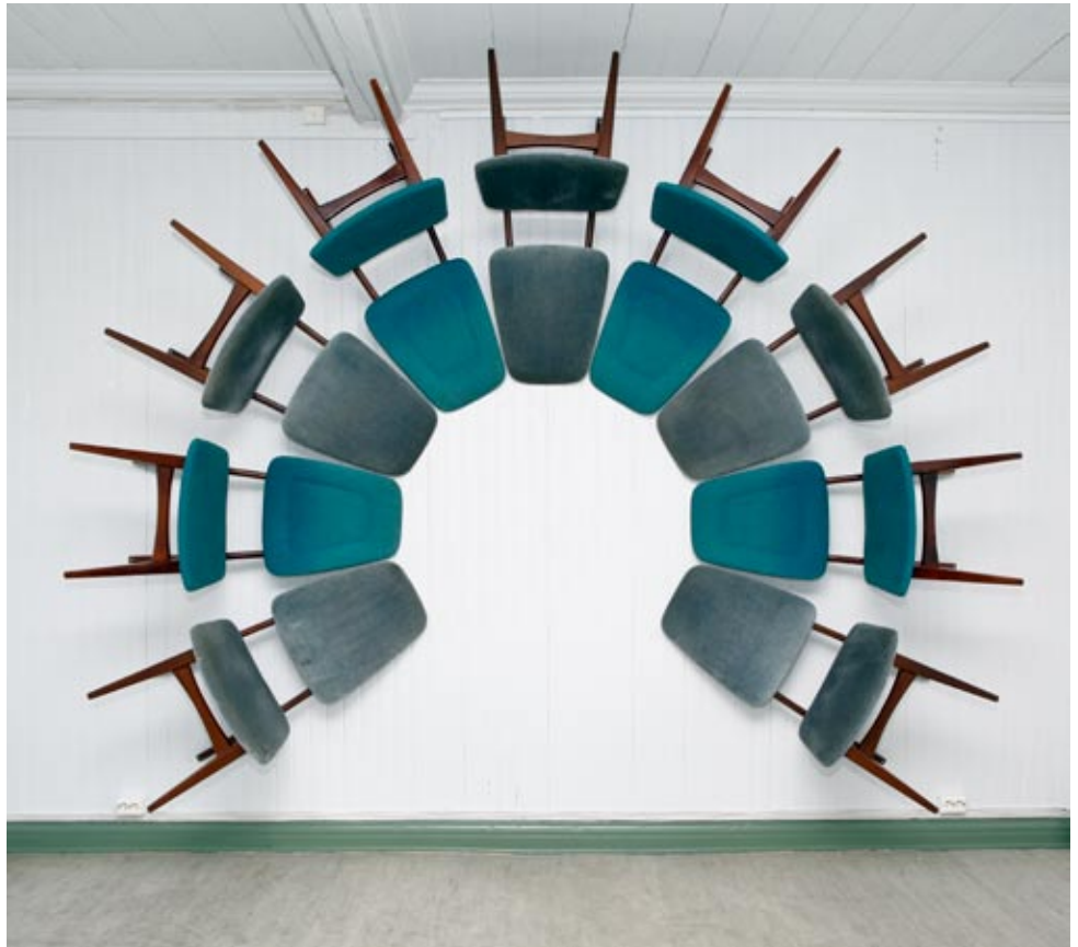
"Rastad & Relling in circular" 2009