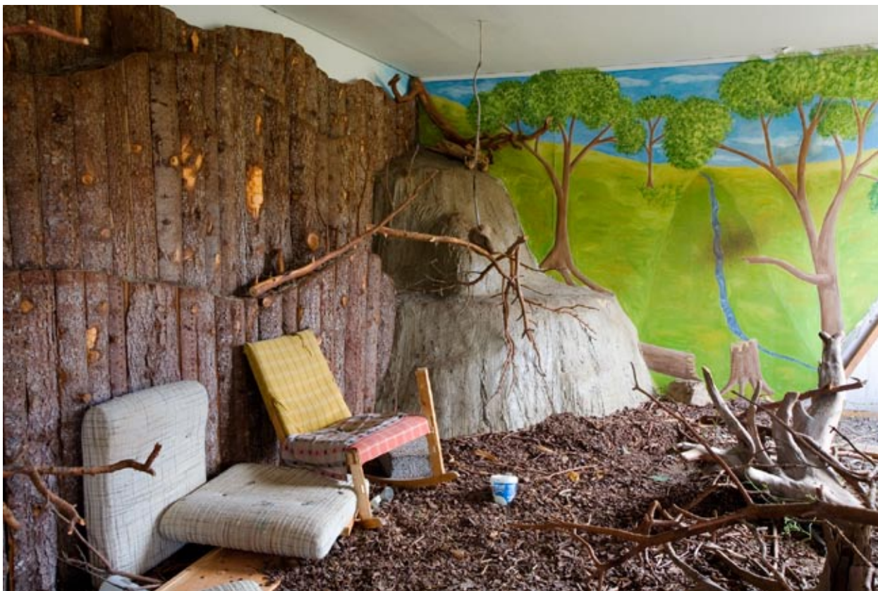
Fra fotoprojektet "Negerbyen"