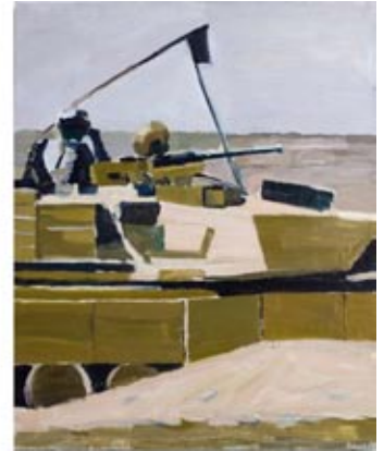
Tanks og Bilvrak